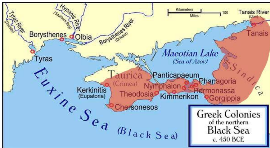
Рис. 4 Карта территории городов Боспорского государства