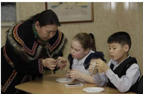
Процесс изготовления кулона