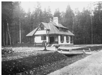
Вид сторожевого домика в Беловежской пуще, 1900 г.

1588 г. В нем достаточно полно освещались вопросы приобретения, отчуждения земель, лесов и других природных ресурсов. Статут детально определял порядок пользования, устанавливал правила охоты, бортничества, рыбной ловли. Была предусмотрена ответственность за нарушение правил. В дошедших до нашего времени летописях и документах судебной системы XIII – XVI вв. часто встречаются материалы, в которых говорится об охране рыбных и охотничьих угодий, бобровых гонов, бортовых деревьев. И хотя эти мероприятия были направлены прежде всего на регулирование отношений и сохранение прав собственности на природные объекты и ресурсы имущих слоев населения, церкви, государственных образований, все же нормы, заложенные в Статуте, содействовали охране природных комплексов, редких животных и птиц. В качестве примера можно привести создание крупными землевладельцами на примечательных природных территориях дворцово-парковых ансамблей, пейзажных парков.