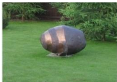
Памятник бульбе в Минске

2008 год был объявлен ЮНЕСКО годом картофеля. Думаю, что больше всех этому были рады жители Беларуси. Ведь у многих эта страна ассоциируется с «бульбой» - картошкой. А самих белорусов в шутку называют бульбашами.